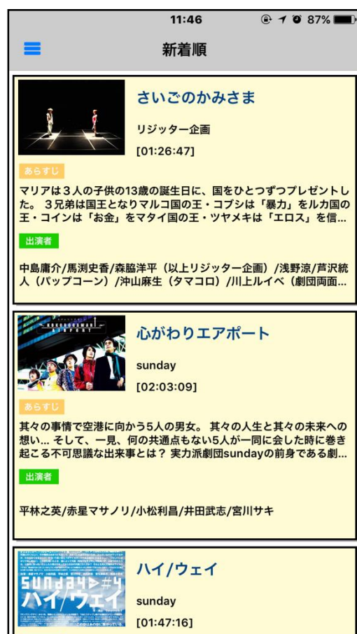
【観劇三昧】アプリ画面

【観劇三昧】では、オンラインで視聴できることから、資金などの問題で地域外に出られない劇団を全国にプロモーションすることができます。 観客は、【観劇三昧】を通じて地域の劇団を知り、今度はその場所へ足を運ぶきっかけにもなることから、地域の活性化にもつながります。 今後も、地域創生の役割を担えるよう、事業を拡大し、サポートを強化していきます。